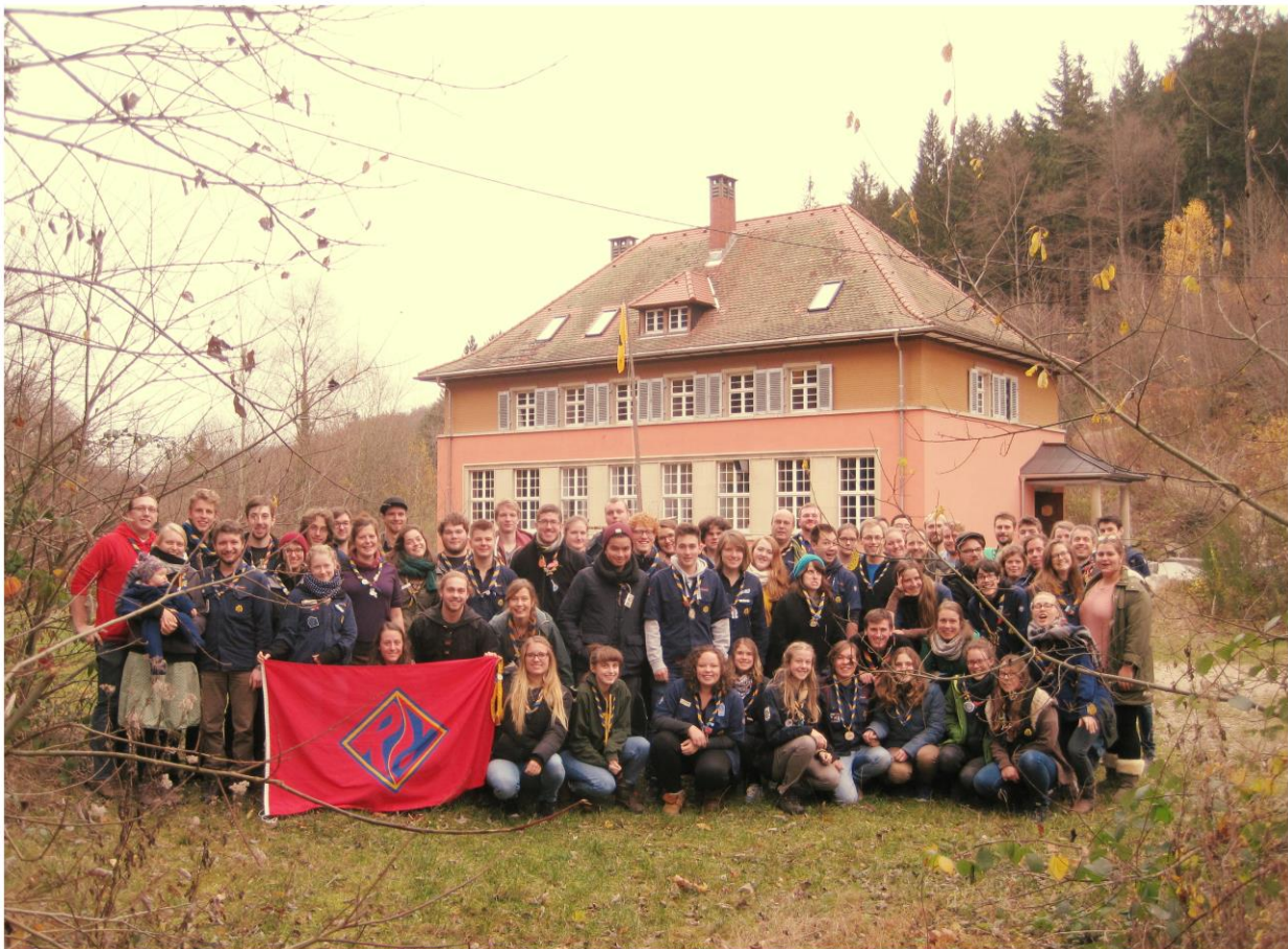
Gruppenfoto auf dem schweR/Rpunkt 2016

Ideen und Vorschläge an max@bdp-bawue.de