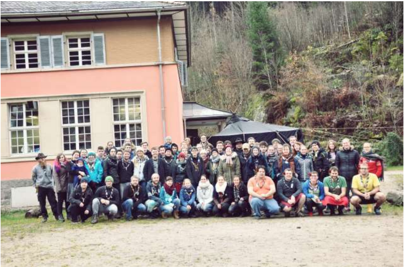
Gruppenfoto auf dem schweR/Rpunkt 2017

Ideen und Vorschläge gerne an max@bdp-bawue.de